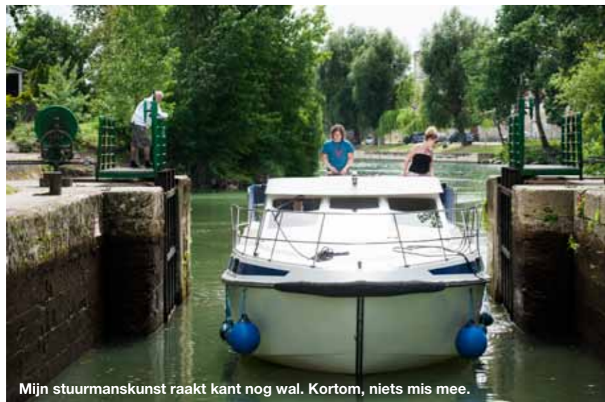
Mijn stuurmanskunst raakt kant nog wal. Kortom, niets mis mee.

Over de vraag of het mocht maakte ik mij niet druk. Het was al geboekt. Het mocht. 'Sans permis, c'est permis!' las ik op de website van bootverhuurder Les Canalous/FPP Travel. Zonder vergunning, het mag! Eronder stond een foto van een stralend modelgezinnetje op het zonovergoten dek van een gigantische boot. Vader lachend aan het stuur.