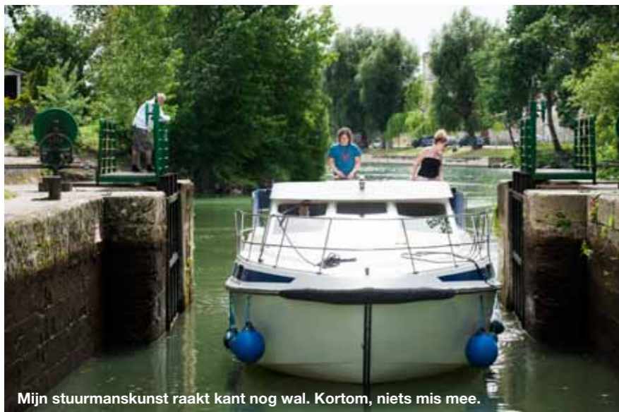
Mijn stuurmanskunst raakt kant nog wal. Kortom, niets mis mee.

Over de vraag of het mocht maakte ik mij niet druk. Het was al geboekt. Het mocht. 'Sans permis, c'est permis!' las ik op de website van bootverhuurder Les Canalous/FPP Travel. Zonder vergunning, het mag! Eronder stond een foto van een stralend modelgezinnetje op het zonovergoten dek van een gigantische boot. Vader lachend aan het stuur.