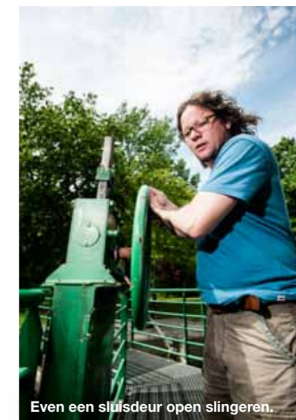
Even een sluisdeur open slingeren.