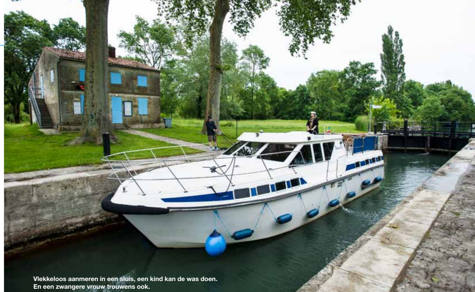
Vlekkeloos aanmeren in een sluis, een kind kan de was doen. En een zwangere vrouw trouwens ook.

lijken. Het gaat al richting het eind van de middag wanneer we slingerend als een ouwe zatlap de stad achter ons laten. Misschien niet eens zo'n heel ongebruikelijke manier om Cognac te verlaten. Hard gaat het niet, zo'n boot. Hooguit een kilometer of 10 per uur. Maar daar gaat het niet om. We worden nergens verwacht, we hoeven nergens naartoe. De reis is het doel. Zoals het landschap voorbijglijdt, zo glijden ook de laatste