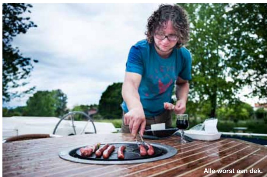
Alle worst aan dek.