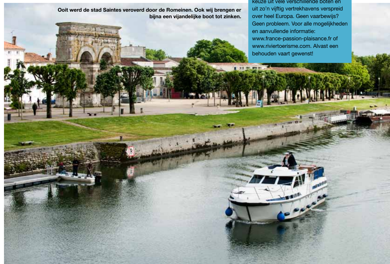
Ooit werd de stad Saintes veroverd door de Romeinen. Ook wij brengen er bijna een vijandelijke boot tot zinken.

Zelf ook eens op een andere manier vakantie vieren? FPP Travel biedt de keuze uit vele verschillende boten en uit zo'n vijftig vertrekhavens verspreid over heel Europa. Geen vaarbewijs? Geen probleem. Voor alle mogelijkheden en aanvullende informatie: www.france-passion-plaisance.fr of www.rivieretoerisme.com . Alvast een behouden vaart gewenst!