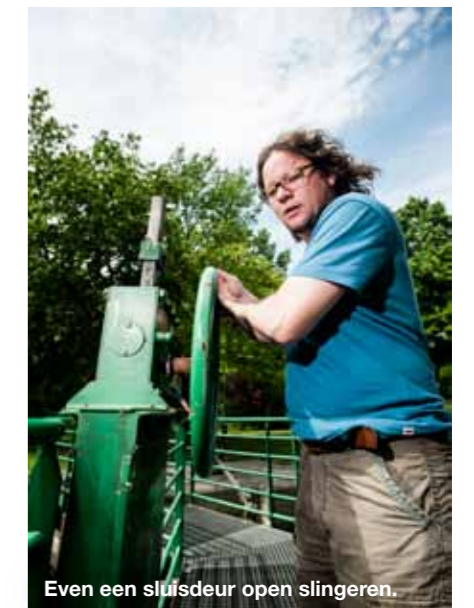
Even een sluisdeur open slingeren.