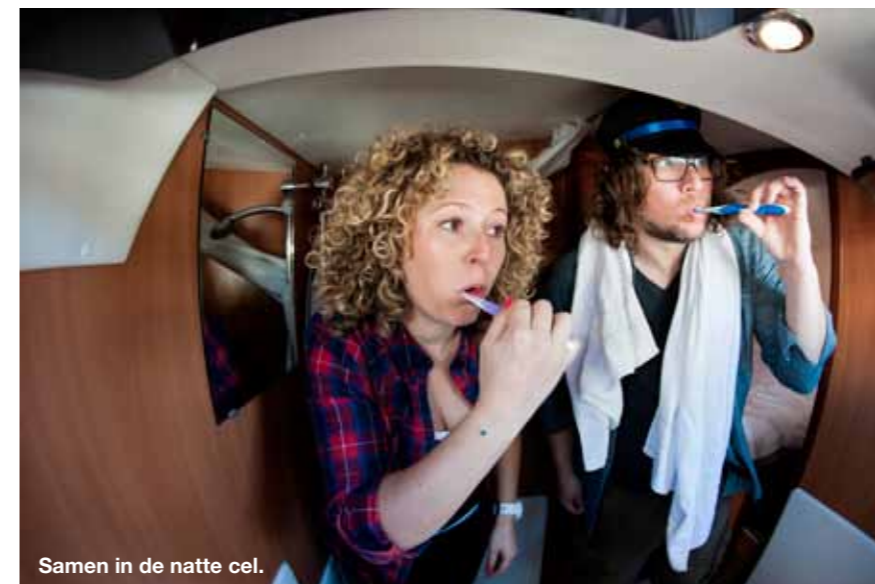
Samen in de natte cel.

Rustig manoeuvreert ze de Solène langs de steiger. Springen hoeft niet eens. Ik stap zo van boord, leg de voor- en