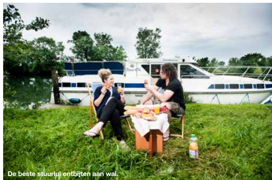
De beste stuurliu ontbijten aan wal.

binnenland, richting Angoulême, waar een prachtige kathedraal schijnt te staan? Het is mij om het even. Totdat Karin zich over mijn schouder heen buigt en vraagt wat toch al die zwarte streepjes zijn op de kaart. Mij was het nog niet opgevallen, maar de hele rivier wordt door zwarte streepjes in stukken gehakt. Soms in grote stukken, soms in kleine. In de legenda zoek ik naar de betekenis ervan. Zwarte streepjes: sluisen. Verschrikt begin ik te tellen. Links van Cognac slechts een stuk of drie, maar rechts ervan wemelt het van de zwarte