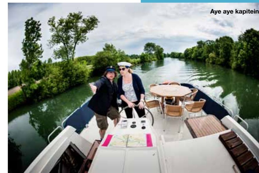
Aye aye kapitein!

Na vier dagen leveren we de boot weer in. Met enige tegenzin maar vooral met gepaste trots. Met nul ervaring hebben we 100 kilometer gevaren. We hebben sluisen getrotseerd, achteruit ingeparkeerd en een hels onweer doorstaan,